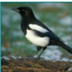
EKSTER 40-51 cm

zwart met gespikkelde borst en rug, vaak in groep