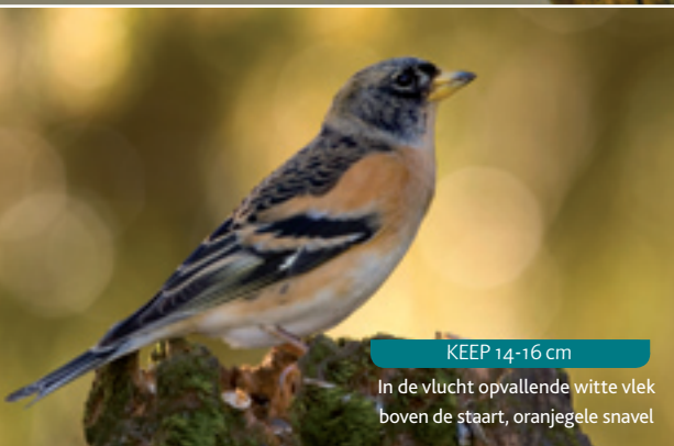
KEEP 14-16 cm In de vlucht opvallende witte vlek boven de staart, oranjegele snavel