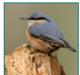
BOOMKLEVER 12-14,5 cm

Kleine bruine mees met opval- lende kuif, bewoont naaldbos