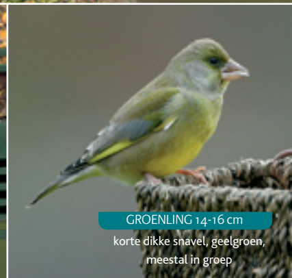
GROENLING 14-16 cm korte dikke snavel, geelgroen, meestal in groep