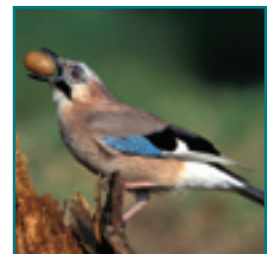
GAAI 32-35 cm

in groepjes en met opvallend grijze hals