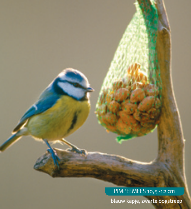
PIMPELMEES 10,5 - 12 cm blauw kapje, zwarte oogstreep