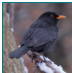
MEREL (man) 23,5-29 cm zwart met gele of bruine bek