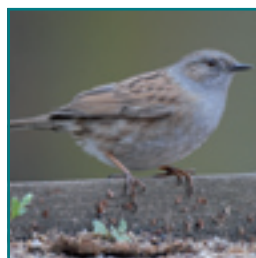
HEGGENMUS 13-14,5 cm bruin gestreepte borst, grijze kop, onopvallend rondscharrelend op de grond