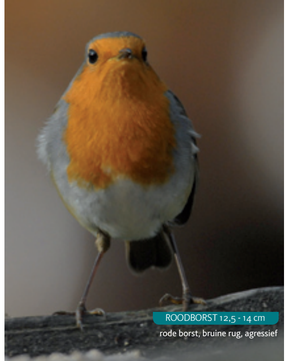
ROODBORST 12,5 - 14 cm

Donker, opvallende witte vlek op achterhoofd