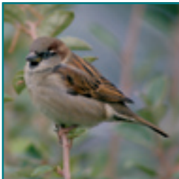
HUISMUS 14-16 cm

korte dikke snavel, grijsbruin zonder opvallende kleur