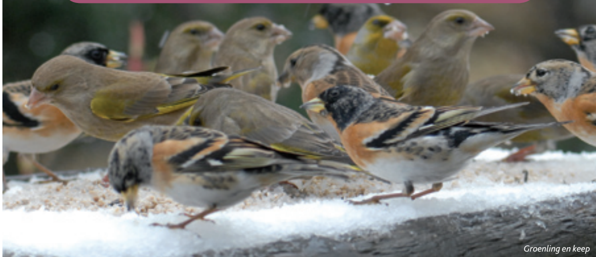
Groenling en keep

In het weekend van 7 & 8 februari 2009 organiseert Natuurpunt, met de steun van Tom & Co en Animal Center Tom&Co, opnieuw een nationaal telweekend van tuinvogels. Vorig jaar telden bijna 7600 gezinnen mee. Voeder jij deze winter ook je tuinvogels en tel je mee?