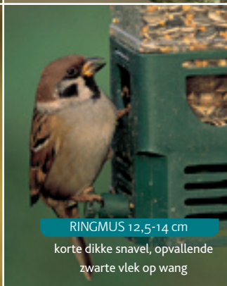
RINGMUS 12,5-14 cm korte dikke snavel, opvallende zwarte vlek op wang