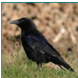
ZWARTE KRAAI 44-51 cm

zwarte kop en hals, veel wit op borst en vleugel, lange staart