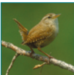
WINTERKONING 9-10,5 cm snel, zenuwachtig vogeltje met opstaande staart