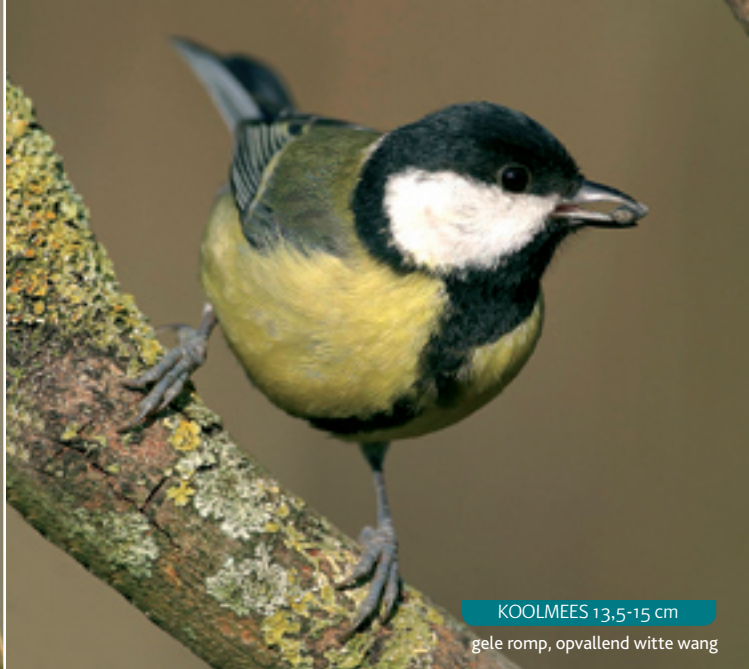
KOOLMEES 13,5-15 cm gele romp, opvallend witte wang