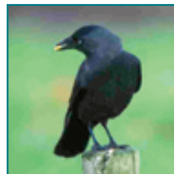
KAUW 30-34 cm

Grote volledig zwarte vogel grote snavel