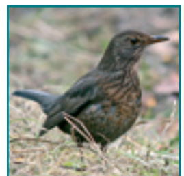
MEREL (vrouw) 23,5-29 cm bruin met oranje of bruine snavel, borst is bruingrijs en nooit wit