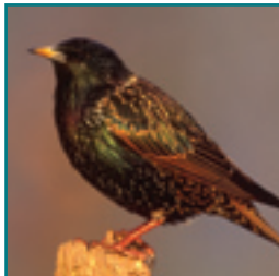
SPREEUW 19-22 cm

korte dikke snavel, grijsbruin zonder opvallende kleur