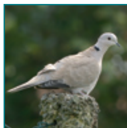
TURKSE TORTEL 31-34 cm vaalbruin duifje met zwarte halsring