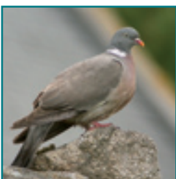
HOUDUIF 38-43 cm dikke duif met opvallende witte halsring en witte vleugelbanen