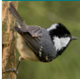
ZWARTE MEES 10-11,5 cm

warm bruine rug en kop, borst wit met pijlpunt vlekken